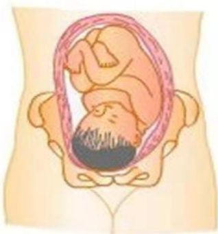
头先露 head presentation