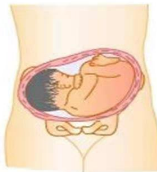
肩先露 shoulder presentation