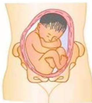
臀先露 breech presentation