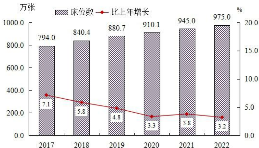
图2 全国医疗卫生机构床位数及增长速度

每千人口医疗卫生机构床位数由 2021 年 6.70 张增加到 2022 年 6.92 张。